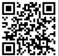
ตัวเชือกสิทธิบัตร